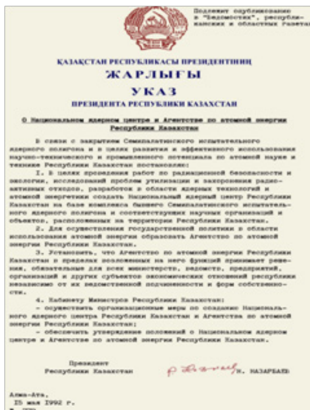
Приложение 3. Рис.3. Указ Президента РК за №779 «О Национальном ядерном центре и Агентстве по атомной энергии Республики Казахстан».15 мая 1992 года. https://www.nnc.kz/news/show/19

в мирных гражданских целях. Этому способствует тот факт, что наша страна сумела сохранить определенный научно-производственный и технико-экспертный потенциал, который стал работать в мирном русле сразу после закрытия полигона. Так, 15 мая 1992 года Указом Президента РК за №779 «О Национальном ядерном центре и Агентстве по атомной энергии Республики Казахстан» на базе комплекса бывшего Семипалатинского испытательного ядерного полигона и соответствующих научно-технических объектов создается Республиканское государственное предприятие «Национальный ядерный центр РК» (далее - РГП НЯЦ РК) [1].