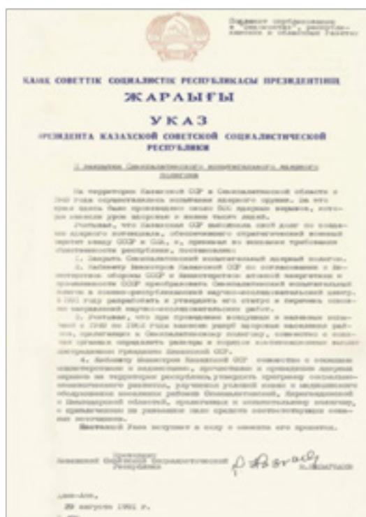
Приложение 2. Рис.2.Указ Президента Казахской ССР Н.Назарбаева от 29 августа 1991года «О закрытии Семипалатинского полигона». https://tengrinews.kz/userdata/images/u289/resized/671da3963874241a125fda9fe110d2f.jpg

И только свертывание советской ядерной программы в конце 1980-х годов, политика местных органов власти и активизация антиядерного движения «Невада-Семипалатинск» привели к прекращению ядерных испытаний и закрытию полигона, которая была юридически оформлена Указом Президента Казахской ССР Н.Назарбаева от 29 августа 1991 года «О закрытии Семипалатинского полигона» (См.прил.2, рис.2).