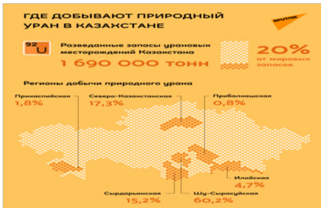
Приложение 4. Рисунок 4. Карта запасов природного урана в Казахстане.

Вместе с тем перспективным направлением в отношениях между нашими странами является взаимодействие в целях развития атомной энергетики в мирных и промышленных целях, в соответствии с положениями ДНЯО. Поскольку Казахстан является страной с большими запасами урана (почти 40% ежегодной мировой добычи), а Республика Корея – это страна, активно потребляющая и использующая атомную энергетику (в стране планируется увеличить долю атомной энергетики в общей доле энергетики до 56 % к 2021 году), то здесь вырисовываются широкие перспективы для двустороннего взаимодействия. Так, более трети потребляемого в Корее урана поступает именно из Казахстана [21]. Объем же добычи «Казатомпрома» в 2021 году сохранится на уровне менее 23 000 тонн урана [22] (См.прил.4., рис.4).