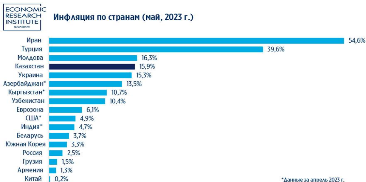
1-диаграмма. Елдер бойынша инфляция (2023 жыл мамыр)

Сондай-ақ, әлемдік даму үрдісіне ықпал еткен жаһандық трендтер ықпалы айқын сезіле бастады. Мәселен, Pew Research Center (2024) жүргізген сауалнама нәтижесіне сәйкес, 31 елдің респонденттерінің 54%-ы демократиялық жүйеге көңілі толмайтынын білдірген. Бұл – халықаралық деңгейде де қоғамдық сенімнің әлсіреуін айқындайтын маңызды көрсеткіш [11]. Қытай мен Үндістан экономикасының, әскери потенциалының одан әрі көтерілуі [12], Ресейдің әлемдік аренадағы жағымсыз белсенді рөлі [13], нақты қатысуды арттыру кезінде АҚШ-тың Трамп билігі тұсында оқшаулануы, ал Байденнің билікке келуімен бірге, әлемдік саясат пен экономикада АҚШ белсенділігінің қайта артуы [14] және аталғандардың аймақ елдеріне жағымды немесе жағымсыз әсері де нақты көрінді.