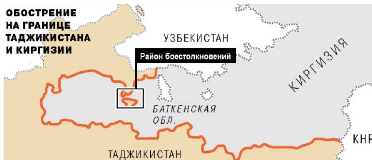
2-сурет. Тәжікстан мен Қырғызстан арасындағы шекара мәселесі

Мегатрендтердің әрекеті аясында Таяу Шығыс пен Орталық Азия аймағында да дамуды бағдарлау процесі айқындалып, қауіпсіздік жүйесін жетілдіру қажеттілігі артауда. Алайда, шиеленістердің өсуін батыстық немесе шығыстық модельдің дағдарысы деп қабылдамау керек. Бірақ өркениеттер арасындағы және олардың даму бағдары