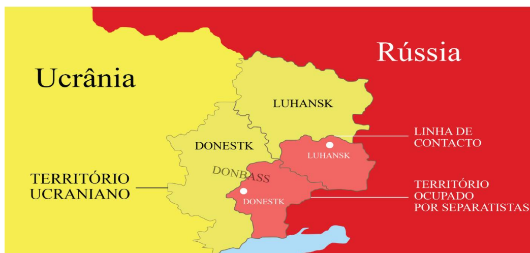
1-сурет. Ресейдің арнайы операция негізінде тәуелсіздік алған аймақ

Сонымен қатар, жас тәуелсіз мемлекеттерінің алдында жаңа проблемалар туды. Халықаралық қатынастар жүйесінде олардың егемендігі мен тәуелсіздігі мойындалып, БҰҰ мүше болғанымен ірі акторлар тарапынан әртүрлі сипатта қысым туды. Себебі, аймақтардағы тұрақсыздық немесе белгісіздік факторы жағдайында әлемді территориялық қайта құру конфигурациясы маңызды трендке айнала бастады. Картада ішінара танылған мемлекеттер пайда болып сепаратистік тенденциялар мен оқшаулануға ұмтылыс күшейеді. Украинаның шығысында Ресейдің тікелей қолдауымен сепаратистік Донецк Халық Республикасы және Луганск Халық Республикасы пайда болды [17]. Бұл қалыптасқан егемендік, тәуелсіздік, дербестік, шекараға қол сұқпау принципін бұзды [18].