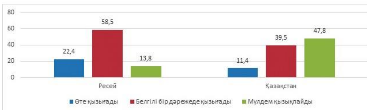
Диаграмма 3. Жастардың саясатқа қызығушылық деңгейі

Қорыта келе, екі елдің жастарының саясатқа қызығушылық деңгейінде айтарлықтай айырмашылық бар екендігін тұжырымдауға болады. Жалпы, Қазақстанда жастардың жартысына жуығы саясатқа мүлдем қызықпайтыны белгілі болса, Ресейде бұл көрсеткіш әлде қайда төмен - 13,8% (3 диаграмманы қараңыз).