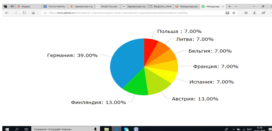
1-сурет. Респонденттерді ел бойынша бөлу

Зерттеудің нәтижелері төменде келтірілген.