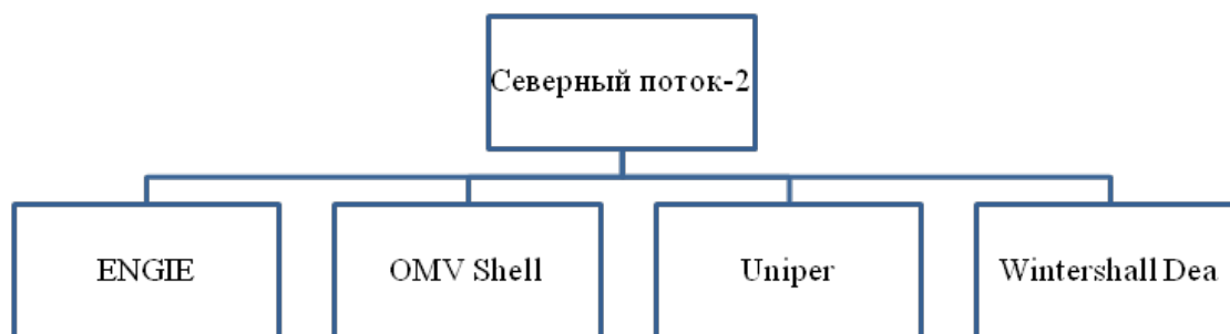
Рисунок 3. Источники финансирования Северного потока-2

Знаковым шагом стало урегулирование сорокалетнего датско-польского конфликта