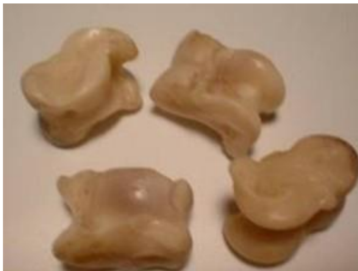
Сурет 1. Асық

Асықтың физиологиялық ерекшелігіне байланысты атауы: