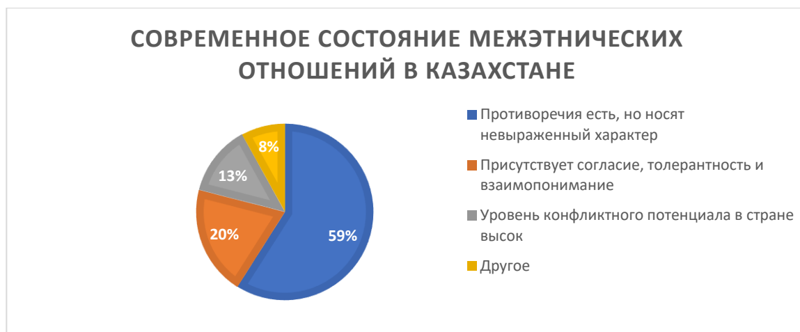
Рисунок 2. Сравнительные данные экспертных опросов от 2002 и 2016 годов, которые были проведены Казахстанским институтом стратегических исследований при Президенте РК (КИСИ) и ОФ «Центр социальных и политических исследований «Стратегия» соответственно

Как вы считаете, в каких сферах проявляются межэтнические проблемы?