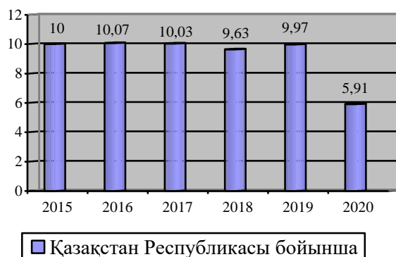
Сурет 2. Қазақстан Республикасы бойынша бір компьютерге оқушылар саны. (2015-2020 жж.) [4]

Жыл өткен сайын білім беру саласын цифрландыру үшін ең қарапайым және бастапқы жұмыс, білім алушыларды компьютермен қамтамасыз ету жұмыстарын жүргізу болып табылады. Мемлекеттік статистика комитетінің мәліметтеріне сүйенетін болсақ, бір компьютерге қанша оқушыдан келетінін анықтауға болады. Демек, білім беру саласын цифровизациялау ең алдымен компьютермен қамтамасыз етуден басталады.