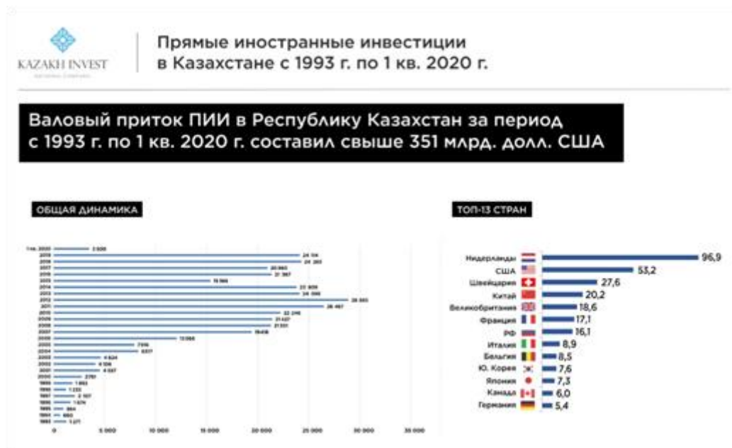
Рисунок 2. Национальный Банк Республики Казахстан

европейскими странами увеличился на 21,4% и составил $28,9 млрд. Доля экспорта составила $23,3 млрд, импорт - $5,7 млрд. При этом Казахстан планирует и дальше увеличивать объем взаимной торговли с ЕС [2].