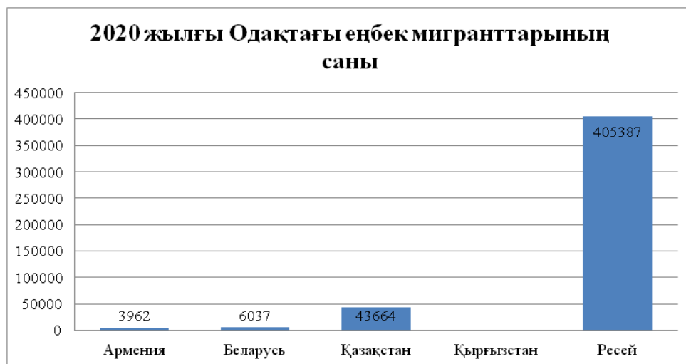
Сурет 4. Еуразиялық экономикалық комиссия мәліметі негізінде жасалды[7].

Одақ мемлекеттерінің азаматтары біліктіліктеріне сәйкес заңды түрде жұмыспен қамтылуға мүмкіндіктер қамтамасыз етілген. Ресей, Қазақстанға жұмысқа орналасқан Армения және Қырғызстан азаматтарының бәсекеге қабілеттілігі артқан. Еңбек мигранттары медициналық қызмет көрсету сияқты басқа да әлеуметтік жеңілдіктерін барған ел азаматтарымен тең дәрежеде алу мүмкіндігіне қол жетізуде. Сонымен қатар, ЕАЭО туралы шартта ортақ еңбек нарығын қалыптастырудың келесідей принциптері қарастырылған: