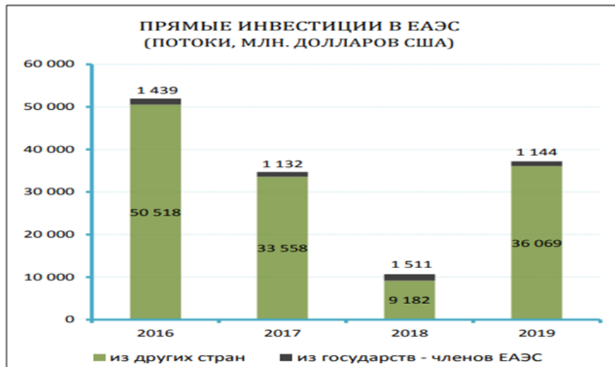
Сурет 3. ЕАЭО тікелей инвестиция көрсеткіші. Дереккөз[7].

артуы байқалады. 2021жылғы инвестицияға жағымды елдер рейтингінде Ресей 30-шы, Қазақстан 54-ші, Беларусь 73-ші, Армения 90-шы, Қырғызстан 98-ші орында, әсіресе Ресей, Қазақстан, Беларусь елдері бұрынғы рейтингпен салыстырғанда алға шыққан[9].