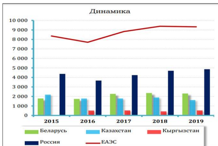
Сурет 2. Өзара қызмет көрсету динамикасы. Дереккөз[7].

көрсету, инвестиция, еңбек миграциясы, мемлекеттік сатып алу, техникалық реттеу сияқты интеграция объекттері де басымдыққа ие болуда. Мұны зерттеушілер «ДСҰ-плюс» режимі аясындағы интеграцияның тереңдеуімен, елдердің аймақтық деңгейде көпжақты либерализацияға ұмтылуымен байланыстырады[8; 254 б.]. Осы тенденцияны Еуразиялық экономикалық одақ тұрғысынан қарастыратын болсақ, бірқатар оң көрсеткіштерді байқауға болады. Бүгінде одақтың қызметтері нарығында 49-дан астам сектор бар, олардың жалпы жиынында өндірілетін қызмет көлемінің 55%-ы сол секторлардың үлесіне тиесілі. Басты қызмет түрлеріне құрылыс саласы, қоғамдық тамақтану қызметі, қонақ үй саласы, компьютерлік, кеңес беру қызметтері және де жылжымайтын мүлікке қатысты қызмет түрлері жатады. Еуразиялық экономикалық Комиссияның статистикалық мәліметтеріне сүйенсек, 2019 жылы одақ ішіндегі өзара қызмет саласының үлесі жалпы қызмет экспортының 11,6%-ын құраған[7]. Қызмет көрсету бойынша саудада әлдеқайда оң динамика сапар, транспорт, іскерлік, құрылыс, телекоммуникация, компьютер және ақпараттық қызмет салаларында байқалады. 2019 жылы олардың үлесі жалпы өзара қызмет экспортының 88%-ын құраған. Ең жоғарғы өсім сапар, әсіресе Ресейден Қырғызстанға іскерлік сапарлар есебінен байқалып отыр. Мысалы, 2-суреттен